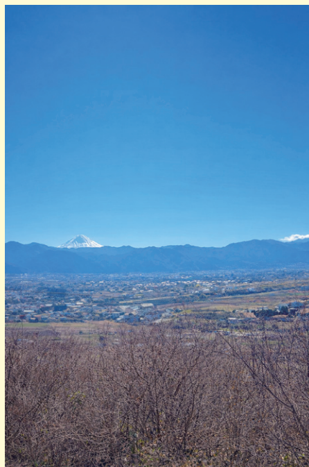
写真：お散歩で、高台まで

これまでも周囲の支えを実感する場面はたくさんあったが、この一年は特に身に染みだ。仕事を越えた出会いが、そうさせているのだろう。穏やかな時間の流れの中に身を置いているということもあるのだろうが…。いずれにしても、思っている以上に社会は温かいし、優しい。娘とのお散歩道中で青空を見上げながら、そんなことを考えている。4月から仕事に復帰する。育休中の出来事が、私の教師としての周囲との関わり方の土台になるはずだ。