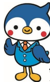
保健事業キャラクター コーヘーくん