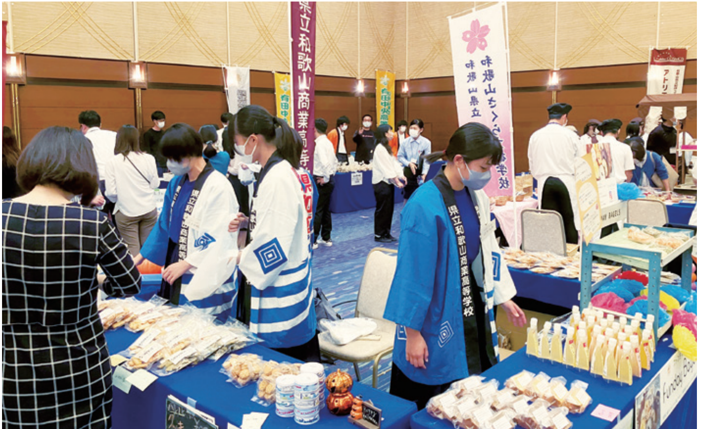
ロハスフェア等地域のイベントでの販売実習の様子