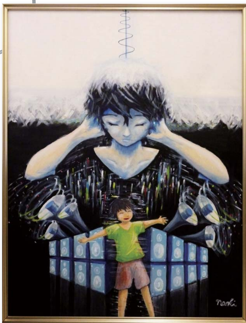
F30号 油彩 2013年度 かねでんコラボアート21 佳作入選

僕は音は聞こえないけど、もし音を色にして見ることができたら、 きっとカラフルな色たちが飛び交っているように見えるんだろうなあ、と想像して描いた作品です。