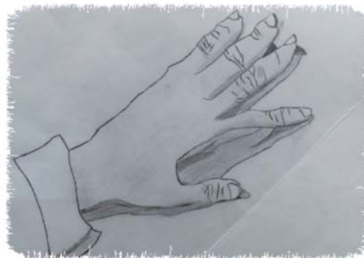
デッサン「ぼくの手」 高等部生徒作品