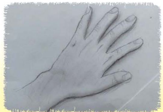
デッサン「私の手」 高等部生徒作品