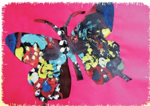
デカルコマニー「蝶」 高等部生徒作品