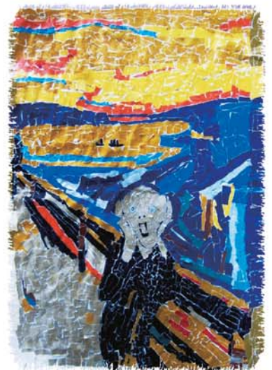
ちぎり絵「ムンクの叫び」 高等部生徒作品