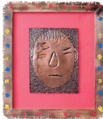
銅板レリーフ作品「顔」 高等部生徒作品