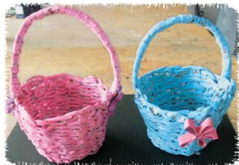
アンデルセン手芸作品「カゴ」 中学部生徒作品