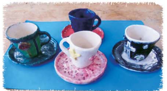
陶芸作品「コーヒーカップとソーサー」 高等部生徒作品