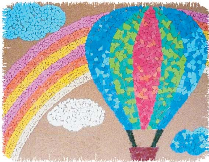
「大空へ」 小学部児童作品