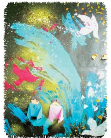
「七夕の世界」 中高部生徒作品