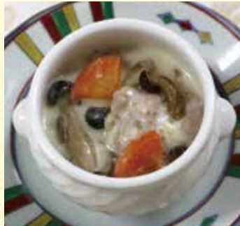
▲チキンクリームシチュー (パイの中身)