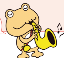
貸付事業キャラクター おたすケロ