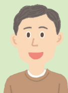
40代・男性 小学校勤務

毎月電話による面談がモチベーションを維持する良いきっかけとなりました。ちょっとした心掛けを続けていくことで体調が変化しました。気付けて良かったです。