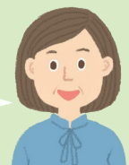
50代・女性 中学校勤務