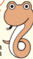
民間金融へびさん銀行員