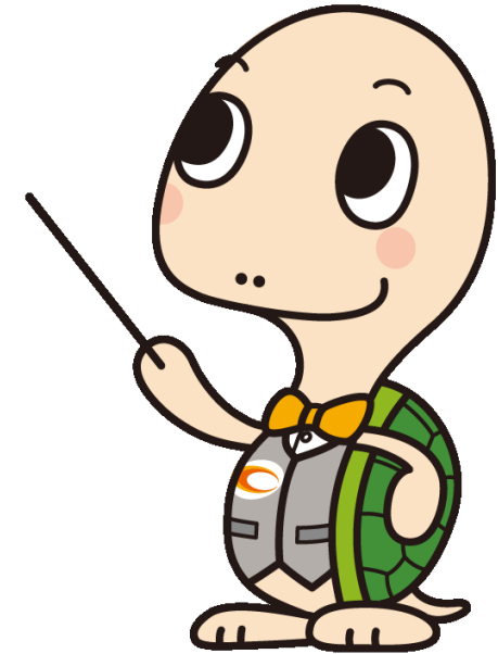
公立学校共済組合 長期給付事業キャラクター かめるん