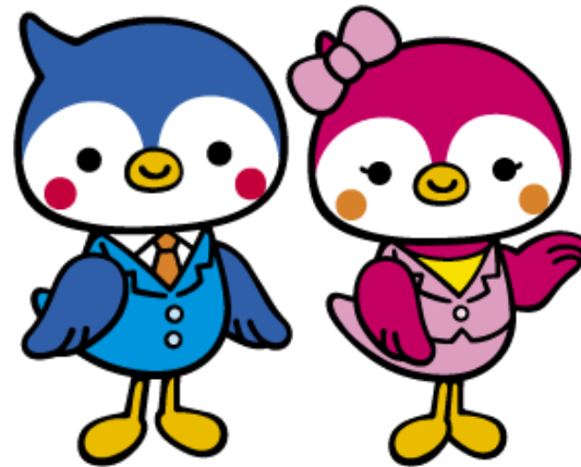
公立学校共済組合 保健事業キャラクター コーヘーくん スズちゃん