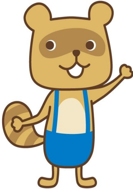
公立学校共済組合 短期給付事業キャラクター タンキちゃん