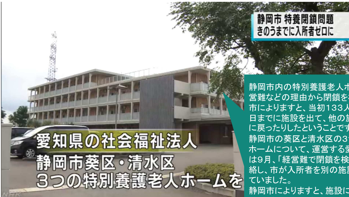
(NHK NEWS WEBより)