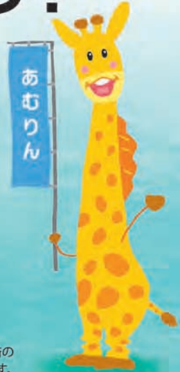
「あむりん」は教職員共済のイメージキャラクターです。

総合共済 トリプルガード レスキューズリー (団体生命共済・医療共済) (交通災害共済) 新・終身共済 年金共済 火災共済 (終身生命共済) (年金共済・適格年金共済) (住宅災害等給付金付火災共済) 自動車共済 車両共済 自然災害共済 (車両保険)