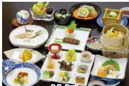
法要会席 桔梗 ききょう お一人様 6,600円