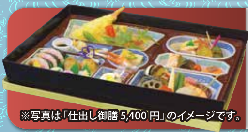
※写真は「仕出し御膳5,400円」のイメージです。

※掲載の料金には、消費税とサービス料が含まれております。※写真はイメージです。※季節によって料理の内容は異なります。