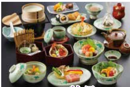
法要特別会席 牡丹 ぼたん お一人様 7,700円