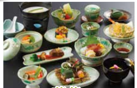
法要会席 蓮華 れんげ お一人様 5,500円

※掲載の料金には、消費税とサービス料が含まれております。※写真はイメージです。※季節によって料理の内容は異なります。