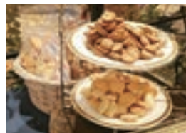
伊万里実業高校と唐津南高校のクッキー