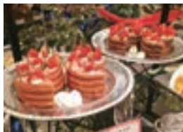
佐賀農業高校と伊万里実業高校のイチゴを使用したケーキ