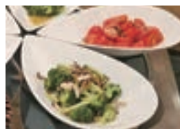
高志館高校のミディマトとブロッコリーを使用した和え物