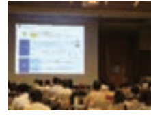
ライフプランセミナー←