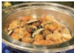
高志館高校のミディマトと伊万里実業高校のシイタケを使用したアクアパッツァ