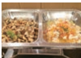
佐賀農業高校の「佐農つず」を使用したエスカベッシュとマリネ