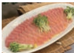
佐賀農業高校の「佐農つず」を使用したカルパッチョ

ご協力(順不同)： 佐賀県立佐賀農業高等学校、佐賀県立高志館高等学校、 佐賀県立伊万里実業高等学校、佐賀県立唐津南高等学校