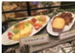
唐津南高校のシフォンケーキとパウンドケーキ