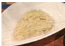
佐賀農業高校のキャベツを使用したコルスロー