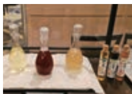
佐賀農業高校の「佐農つず」ドリンク