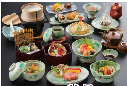
法要特別会席 牡丹 ぼたん お一人様 7,700円