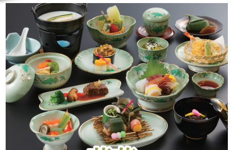
法要会席 蓮華 れんげ お一人様 5,500円

※掲載の料金には、消費税とサービス料が含まれております。※写真はイメージです。※季節によって料理の内容は異なります。