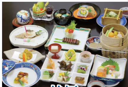
法要会席 桔梗 ききょう お一人様 6,600円