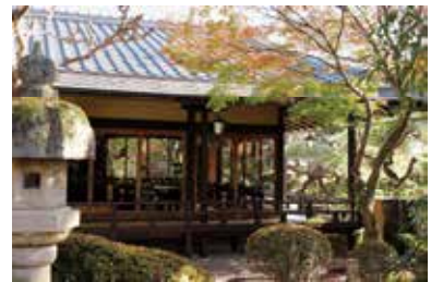
▲ 四方を庭で囲まれた朝食堂