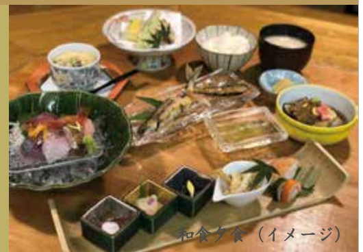
和食夕食（イメージ）