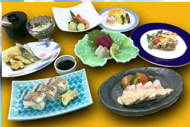
写真は、7月の料理です。