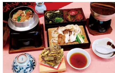
昼食付：松茸料理 (イメージ)