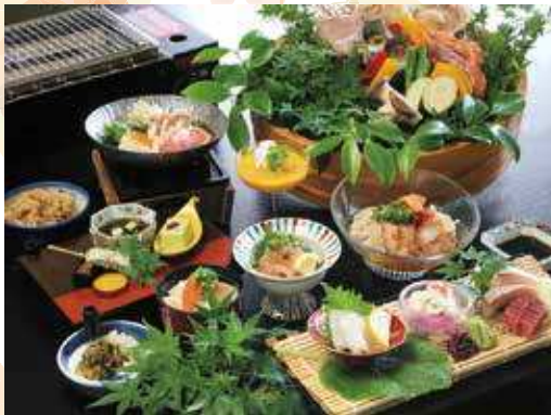
※写真はイメージです。内容は仕入れ状況により変更になる場合がございます。