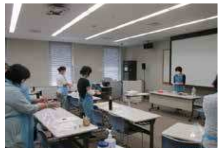
8月6日・Cコース 「感染症対策と排泄ケア」