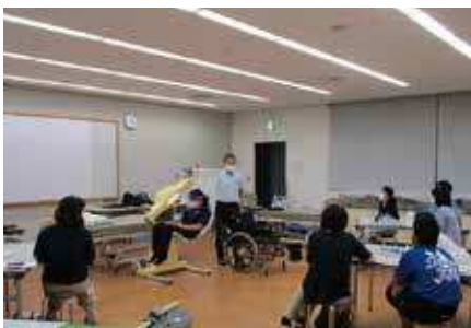
8月4日・Aコース 「介護の心得と福祉用具の選び方」