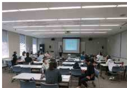
8月5日・Bコース 「認知症の理解と身体のケア」