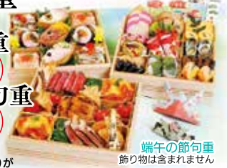
端午の節句重 飾り物は含まれません