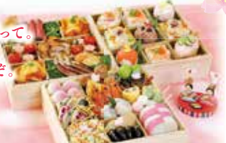
桃の節句重 飾り物は含まれません