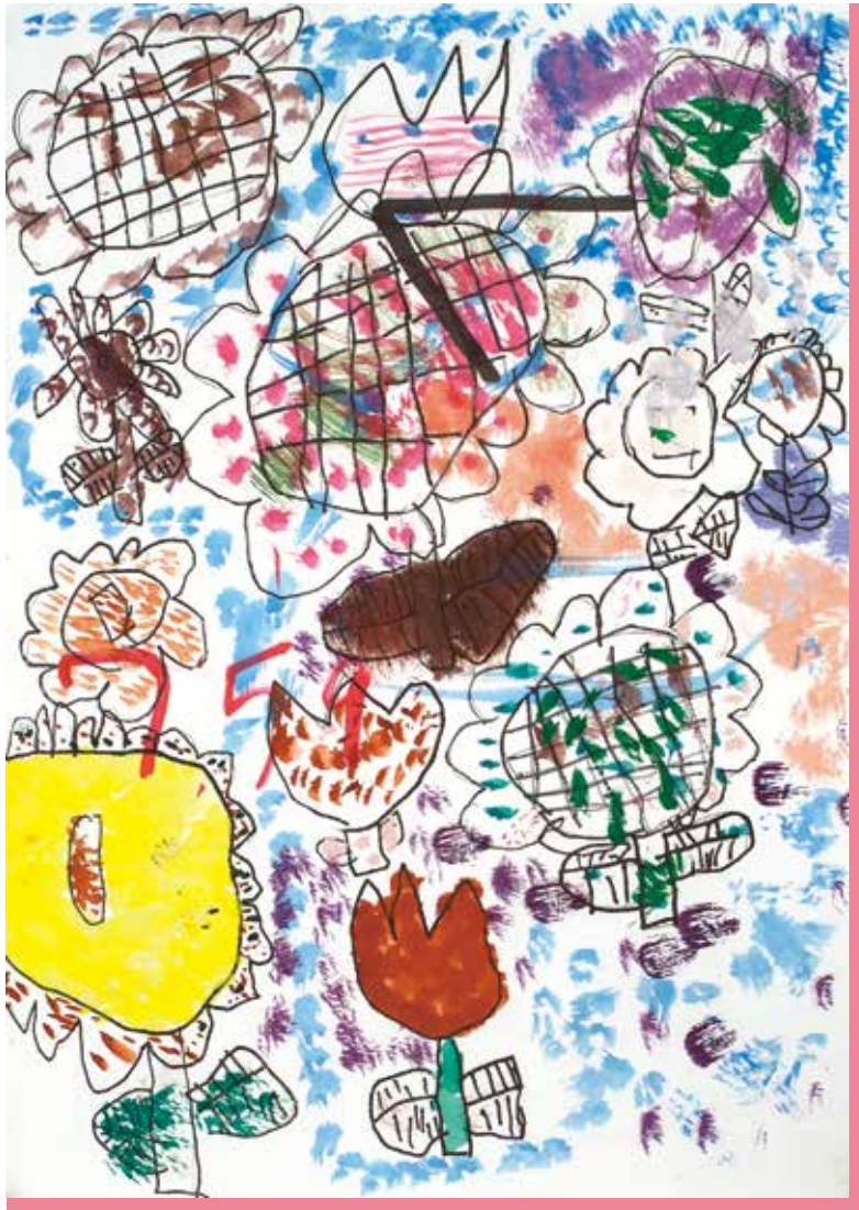
令和2年度鹿児島県図画作品展 特選 「カラフル」

編集・発行 公立学校共済組合鹿児島支部 〒890-8577 鹿児島市鴨池新町10番1号 鹿児島県教育庁総務福利課内