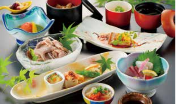
※写真はイメージです。内容は仕入れ状況により変更になる場合がございます。

※曜日や時期により料金が異なる場合がございます。詳しくはお電話でご確認くださいませ。 ※入湯税が別途必要です。