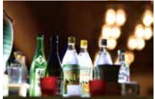
焼酎飲み放題の“いいちこバー”も無料でご利用いただけます。