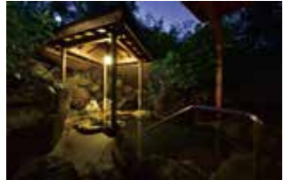
貸切庭園露天風呂を無料でご利用いただけます。