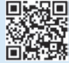
【認証コード確認用】