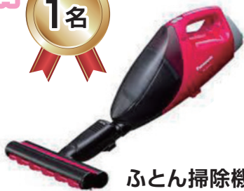
ふとん掃除機 (パナソニック)