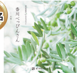
カタログギフト 『べっぴんさん』