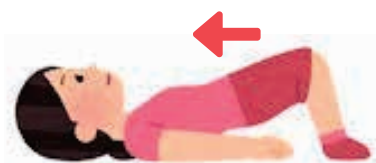
おしっこを我慢するイメージ