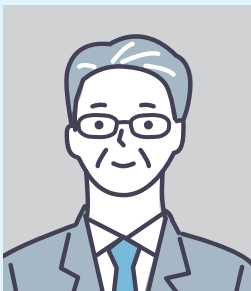
50代 男性 Aさん