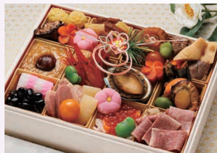
鹿児島県産黒豚黒牛レトルト黒カレー 2袋付