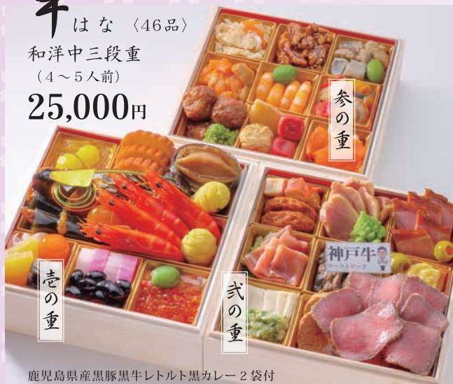
鹿児島県産黒豚黒牛レトルト黒カレー 2袋付