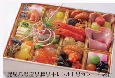
鹿児島県産黒豚黒牛レトルト黒カレー 2袋付