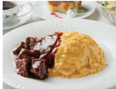
じっくり煮込んだ 神戸ビーフシチューオムライス ドリンクバー付