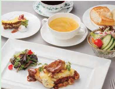
グリルチキンのグラタン仕立て フォアグラソテー添え ドリンクバー付

〈65年記念メニュー〉ランチ 11:30~14:30 (L.O.14:00) 土日祝 11:30~15:00 (L.O.14:30) ディナー 17:00~21:30 (L.O.20:30) ※時短営業要請等により営業時間が変更される場合、休業になる場合もございます。