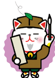
旅ニャン 宿泊事業