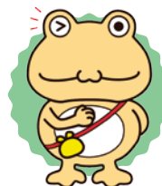
おたすけロ 貸付事業