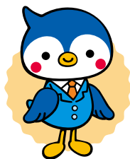
コーハーくん・スズちゃん 保健事業