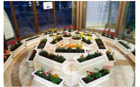
千葉県立葉園台高校 (順次、展示校を入れ替えて継続して展示します。)

この展示により、全国でも有数の花の生産県でもある千葉県農業高校で活動する将来の担い手を応援するとともに農業高校への関心や長引く新型コロナウイルス感染症の影響下における生活の癒しに繋がることを期待しています。