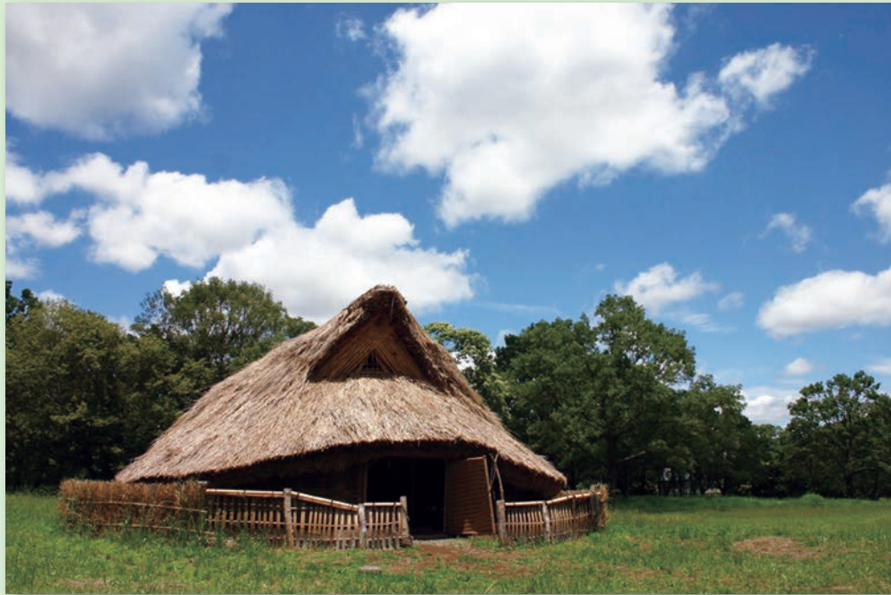
加曽利貝塚の復元住居と、加曽利貝塚から出土した縄文土器