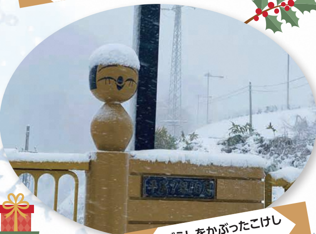
雪ぼうしをかぶったこけし