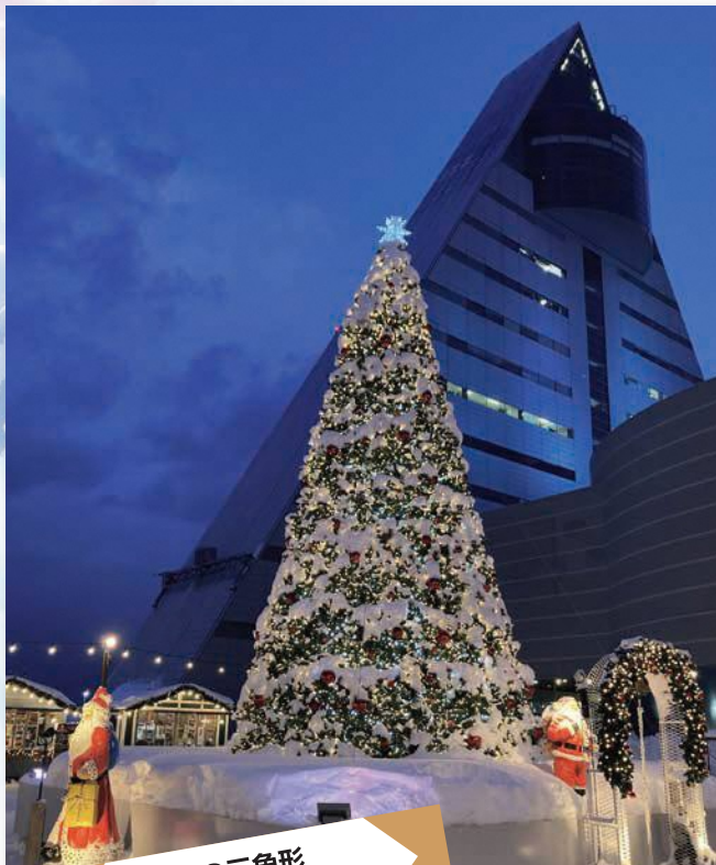
冬の三角形