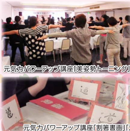
元気カパワーアップ講座「美姿勢トーニング」