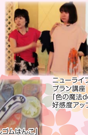
ニューライフ プラン講座 「色の魔法de 好感度アップ☆」