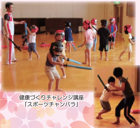
健康づくりチャレンジ講座 「スポーツチャンバラ」