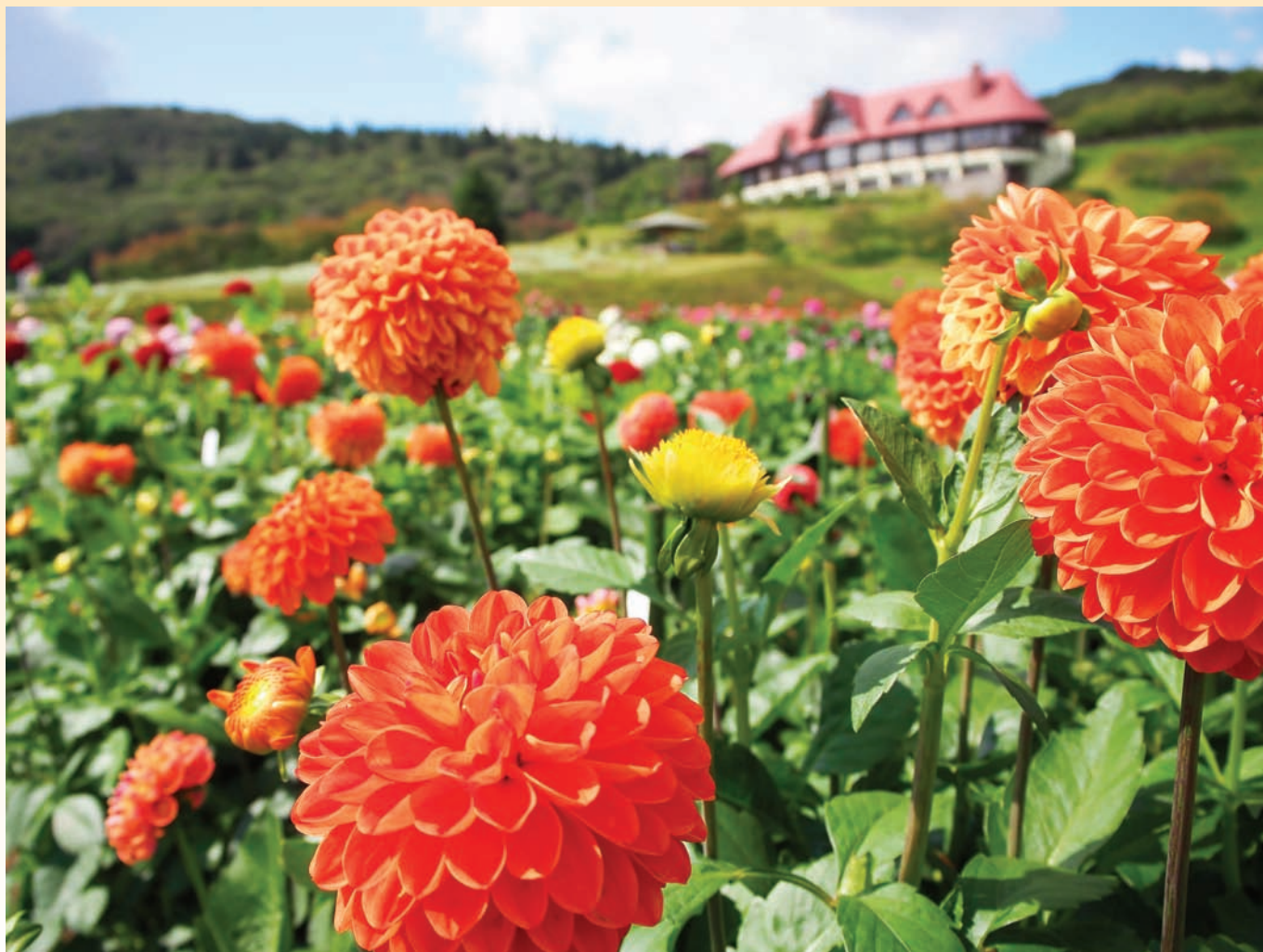
秋田市国際ダリア園