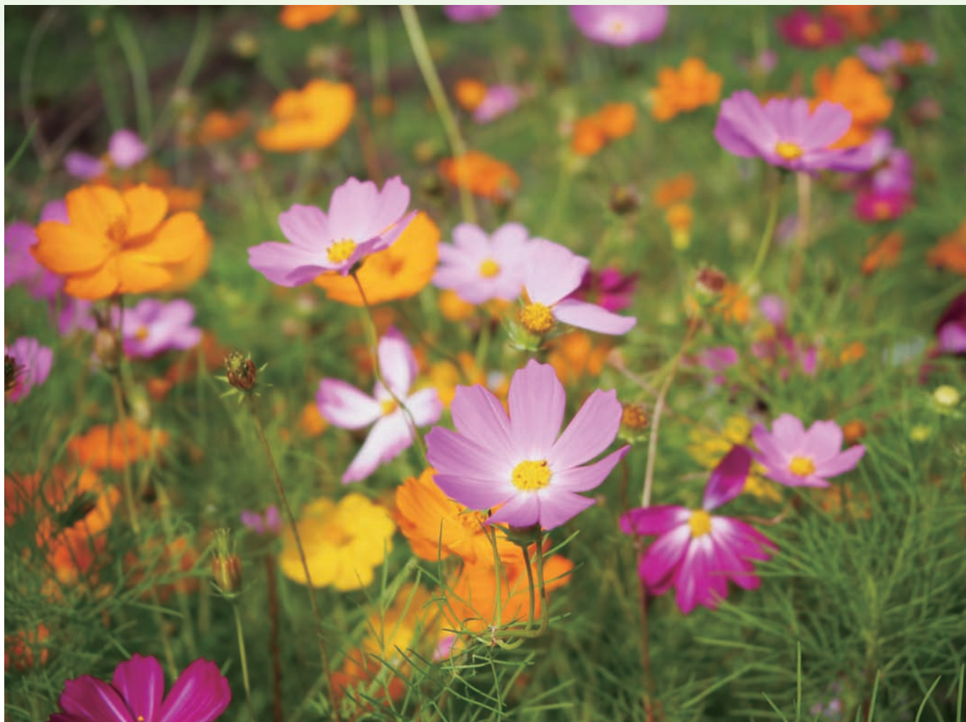
秋田市八橋 コスモスロード