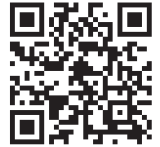
初回登録専用ページ QRコード